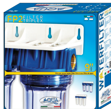
Non disponibile per 20"/Not available for 20"