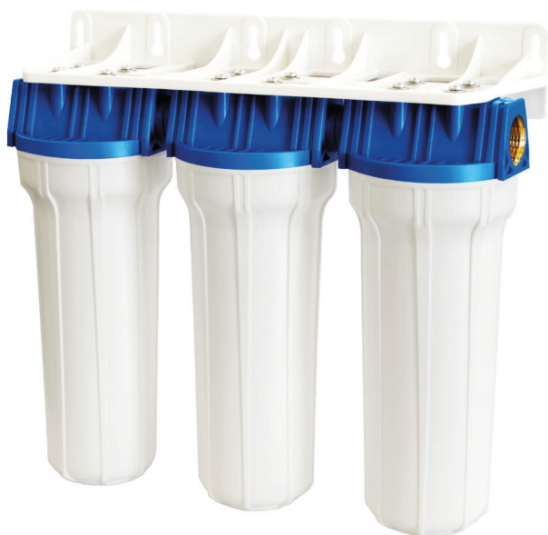
Contenitore per cartucce serie FP2 Triplex testa inserto ottone vaso opaco bianco FP2 Triplex filter cartridge housings with brass inserts and opaque white sump