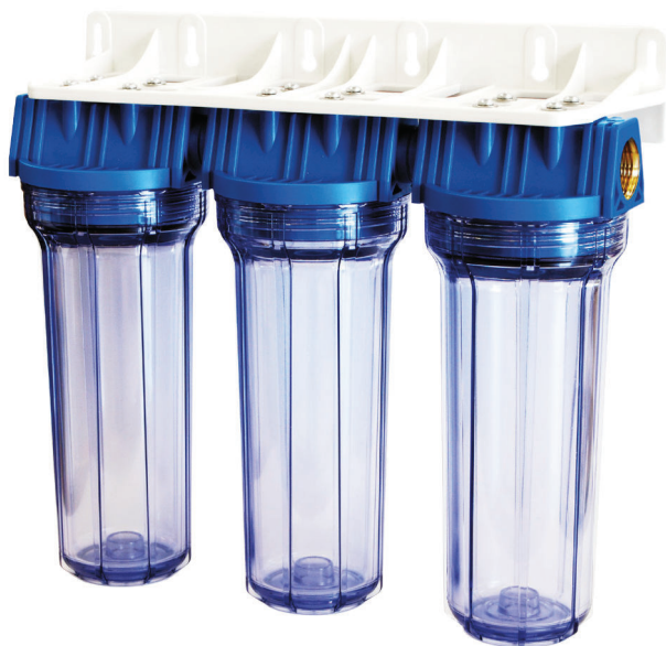
Contenitore per cartucce serie FP2 Triplex testa inserto ottone vaso SAN trasparente FP2 Triplex filter cartridge housings with brass inserts and transparent SAN sump

linea duplex-triplex/duplex-triplex line